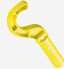
Gancho universal de ajuda para a saída da água