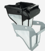
Filtro rígido Filtro de nível duplo: 150/60 µ