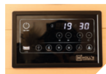
Audio Bluetooth /MP3