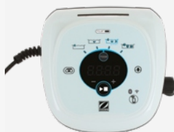
Caixa de comando