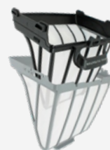
Filtro a Principal 150µ para Dupla filtragem ou utilização sozinho