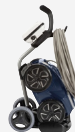
Carro de transporte